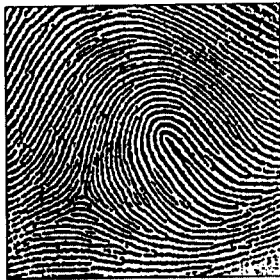
(b) 실험영상 II