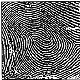
(c) 실험영상 III