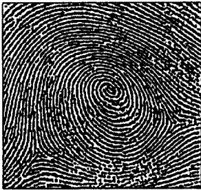
(a) 실험영상 I