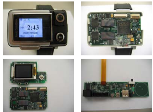
그림 2. 손목시계형 플랫폼 - 정면, 내부, PCB들, 디버깅보드