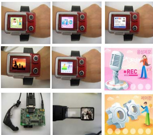
그림 4. MP3 플레이어, 디지털카메라, 비디오폰, 명함전송, MPEG-4 플레이어, 녹음기, 개발보드, HMD, HMD 출력, 제어판

응용프로그램은 시계기능, 개인 정보 관리 기능, MPEG-4 플레이어, 비디오폰, 디지털 카메라, 명함전송, MP3 플레이어, 녹음기 등으로 구성된다. 그림 4에서 보는 것과 같은 응용프로그램과 그 외관을 갖는다.