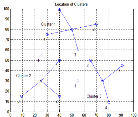
그림 1. 모의실험을 위한 노드 배치 및 클러스터 구성 Fig 1. Nodes Placement and Clusters Organization for the Simulation

클러스터 번호를 세로축은 노드 수명을 가리킨다. 이때 노드 수명은 각 클러스터에서 가장 빨리 죽는 노드를 기준으로 노드 수명을 비교하였다. 가로축에서 각 클러스터 별 왼쪽 막대는 IV장으로부터의 결과에 근거한 비협조 게임에서의 노드 수명을 가리킨다. 각 클러스터 별 오른쪽 막대는 협조 게임에서의 노드 수명을 가리키는데 이는 IV장에서 제시된