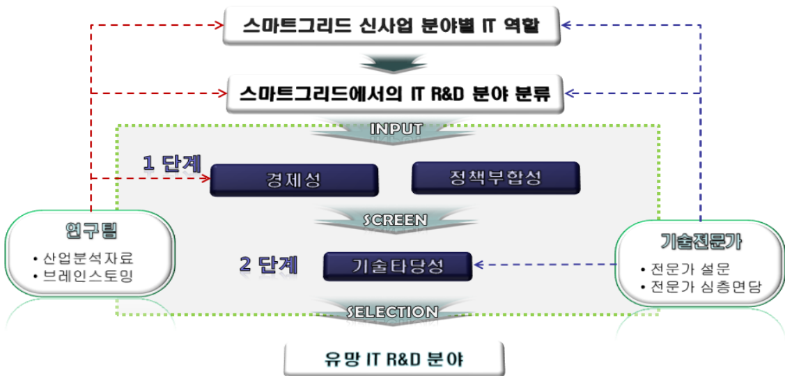
그림 2. 스마트그리드 유망 IT R&D 분야 도출 프로세스

(1) 산업분석자료를 기반으로 ETRI 경제분석연구팀에서 8차례의 브레인스토밍을 거쳐 스마트 신사업 분야별 IT의 역할 도출