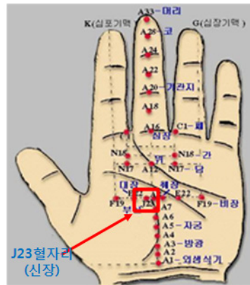
그림 1. 수지침 혈자리 Fig. 1. Hand Acupuncture Point

절시키는 방법을 말한다. 특히 손의 상응부위에 가늘고 짧은 침을 1~2mm 자입한다고 해서 수지침이라고 명명한다 6,71 . 이와 같은 수지침 요법에서 손의 'J 23' 혈자리가 신장과 관련있다는 이론을 제시하고 있으며 본 논문에서는 'J 23' 혈자리 자극에 따른 얼굴 색상 및 음성 변화를 측정하는 실험을 수행하고자 한다. 즉, 기존의 한의학적 망진, 청진 이론을 토대로 IT 기술을 적용하여 신장과 생체영상 및 음성신호간의 상관성 규명 연구를 기반으로 신장 기능이 저하될수록 턱 영역의 색상이 흑색을 나타내고 음성신호의 1포먼트 주파수 대역폭과 짐머값이 상승되는 실험 결과를 적용하여 신장 수지침 반응점을 자극했을 때 신장 기능의 변화를 영상 및 음성신호 분석으로 측정하는 방법을 적용하여 연구를 수행하였다 14,161 .