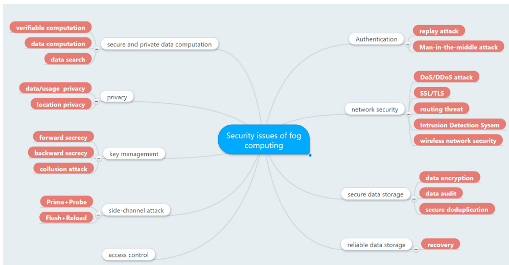
그림 2. 포그 컴퓨팅 보안 및 프라이버시 이슈 Fig. 2. security and privacy issues of fog computing

인증 받으려는 개체가 인증기관에 보내는 인증정보를 공격자가 가로챈 후 재전송하여 인증 받는 방법의 공격이다. 이 공격에 대한 대응방안으로는 세션 토큰(session token)을 사용하는 것이다. 인증기관이 인증하려고 하는 개체에게 세션 토큰을 보내고 인증 개체는 세션 토큰의 해시값을 인증정보에 덧붙여 보낸다.