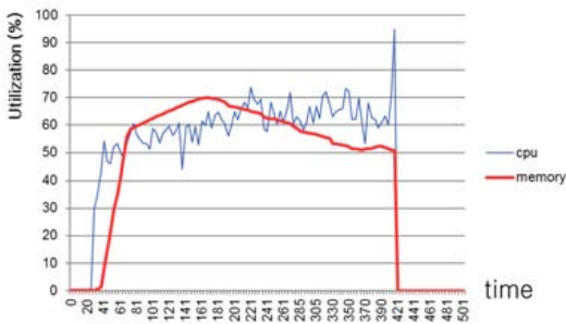
그림 2. CPU / Memory 활용률 Fig. 2. CPU / Memory utilization

가 크게 감소하고 체크포인트 주기 역시 크게 감소하였다. 이후 CPU 활용률이 90% 이상 넘어 갈 시, 컨테이너에 회복 조치가 수행되어 활용률은 급감하고 주기는 회복되는 동작을 보인다. 표1은 8시간의 장애 주기를 갖는 시스템에서 고정 체크포인트 방식과의 효율 차이를 보인다. 시뮬레이션은 하루 간 총 체크포인트 횟수와 자원 활용률이 증가하는 구간의 유효 체크포인트 횟수를 측정하였으며, 고정 체크포인트 방식은 Young의 방식을 활용하여 536초의 주기를 갖는 경우로 계산하였다. 제안하는 알고리즘은 평시 상태의 체크포인트 횟수는 고정 방식보다 적지만, 장애 구간에서 체크포인트 횟수가 급증하여 유효 체크포인트 횟수가 높게 측정되었다. 따라서 고정 체크포인트 방식에 비해 실시간 장애에 빠르게 대응하였고, 높은 효율을 보였다.